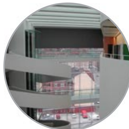
ARoS Århus Kunstmuseum Arkitekt: Schmidt, Hammer & Lassen

ARoS - Århus Kunstmuseum Bella Center A/S MT Højgaard A/S Kolding Storcenter Politiskolen Danske Trælast A/S Systematic A/S Energi E2 Nokia A/S SAS KLP Ørestad A/S